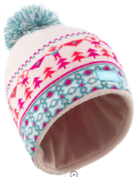
⊖ ⊕ ШАПКА ФЛИСОВАЯ