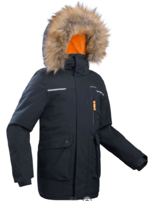
⊖ ⊕ КУРТКА ЗИМНЯЯ ВЛАГОСТОЙКАЯ