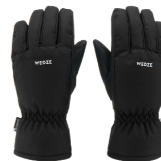
⊖ ⊕ ПЕРЧАТКИ ВОДОНЕПРОНИЦАЕМЫЕ