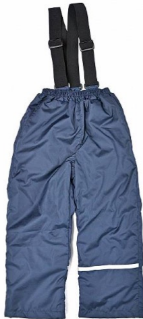
БРЮКИ НА ЛЯМКАХ