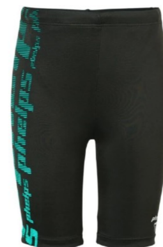
ПЛАВКИ И КУПАЛЬНИК