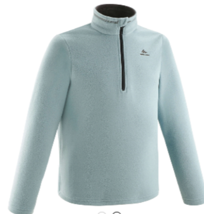
⊖ ⊕ ТОЛСТОВКА ФЛИСОВАЯ