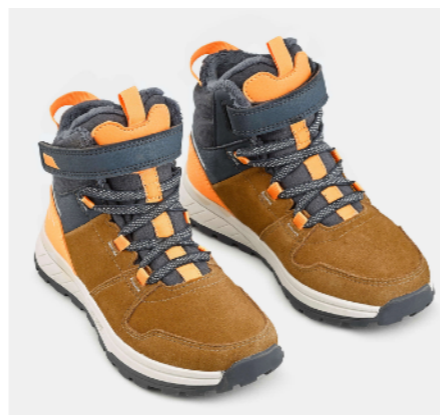
БОТИНКИ ПОХОДНЫЕ ЕСЛИ НЕТ ЛУЖ