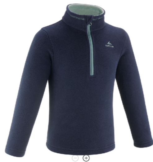
ТОЛСТОВКА ФЛИСОВАЯ ТЕМНАЯ