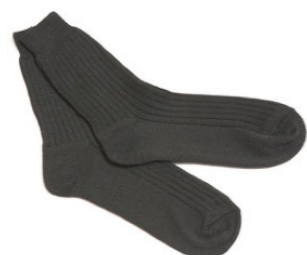
НОСКИ + ЗАПАСНЫЕ