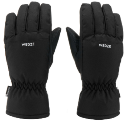
⊖ ⊕ ПЕРЧАТКИ ВОДОНЕПРОНИЦАЕМЫЕ