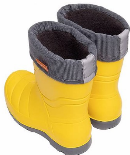
САПОГИ РЕЗИНОВЫЕ ЕСЛИ ЕСТЬ ЛУЖИ