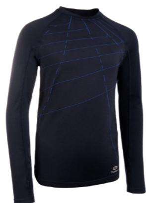
ФУТБОЛКА С ДЛИННЫМ РУКАВОМ