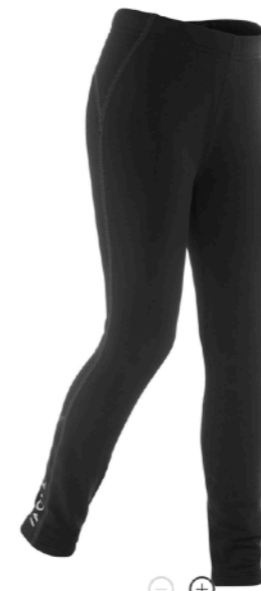
⊖ ⊕ ЛЕГИНСЫ ВЛАГООТВОДЯЩИЕ