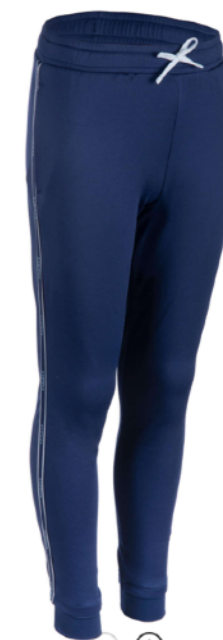
ДЫШАЩИЕ УТЕПЛЕННЫЕ ШТАНЫ