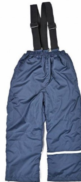
БРЮКИ НА ЛЯМКАХ