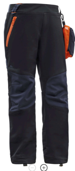
ЛЕГКИЕ БРЮКИ ПОХОДНЫЕ