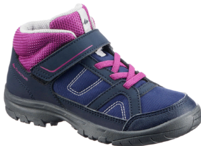
ЛЕГКИЕ ПОХОДНЫЕ КРОССОВКИ